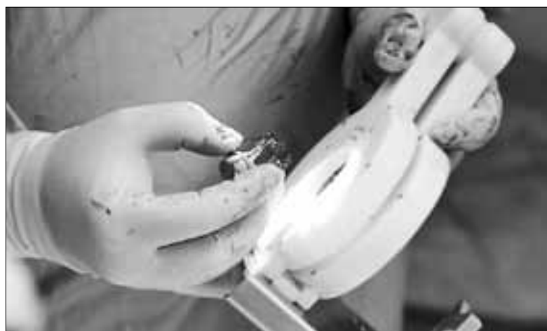
■ Специальная анатомическая форма протеза обеспечивает самозакрепление устройства.

– Это биологический протез, для имплантации которого часто не нужно полностью разрезать грудную клетку. Кроме того, его установка не требует наложения швов. Специальная анатомическая форма протеза обеспечивает самозакрепление устройства. Это уменьшает время как нахождения пациента на искусственном кровообращении, так и всей операции в це-